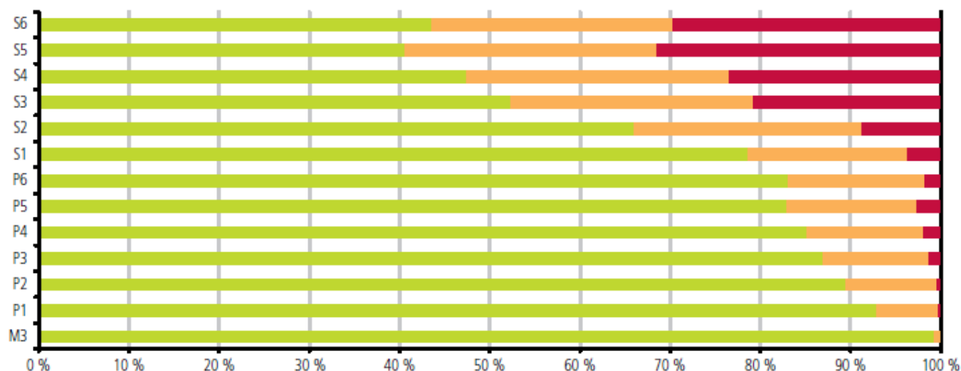
Figuur 10.1: Individuele schoolloopbanen naar onderwijsniveau in het gewoon onderwijs, Franse Gemeenschap, 2017-2018

M = kleuteronderwijs; P = lager onderwijs; S = secundair onderwijs